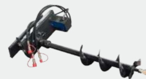
SINFÍN DE PERFORACIÓN