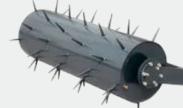
COMPRESOR GIRATORIO CON PUNTAS