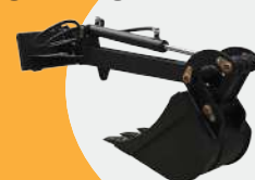
BRAZO DE EXCAVADORA