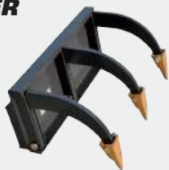
3 DIENTES RIPPER