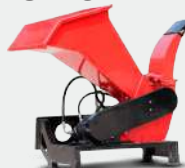
TRITURADORA DE VERDURAS