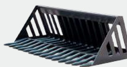
CUCHARÓN PARA ROCAS