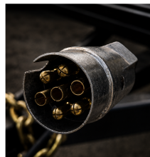
CONECTOR 7 POLOS