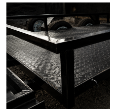
CADENAS DE SEGURIDAD