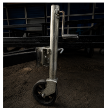
RUEDA DE MANIOBRA