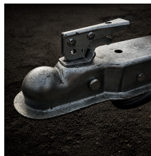
MANO DE ACOPLE